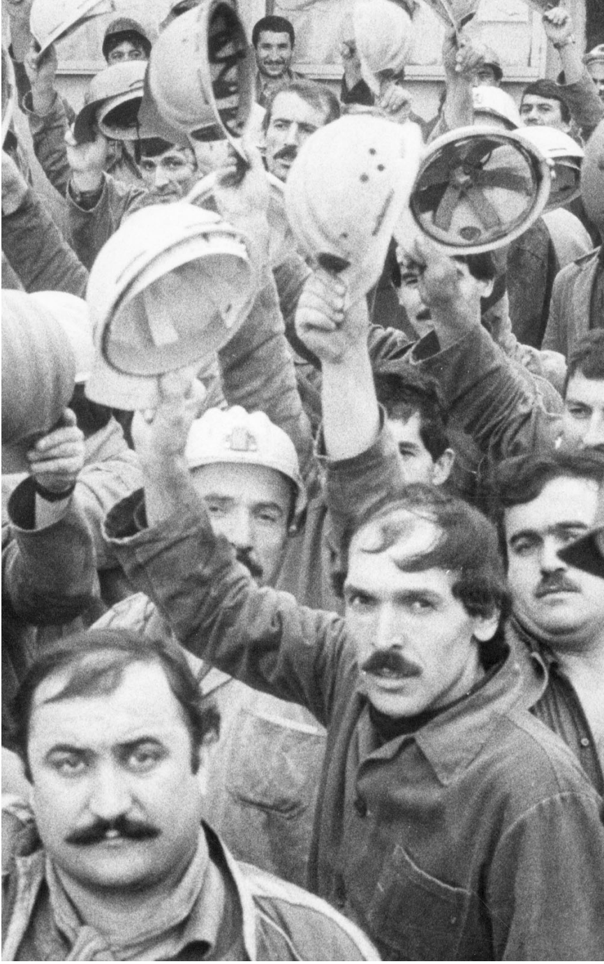
Büyük madenci direnişi 12 Eylül, Özalizmin kayıplarının giderilmesinde en etkili eylem oldu. Kazanımları tüm emekçilere yansıdı.