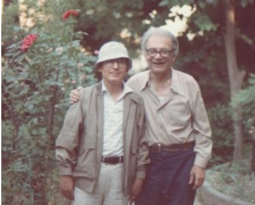
2 güle dikkat..!

Gündüz ve Cahit hocalarımızın kemikleri sızlıyor..