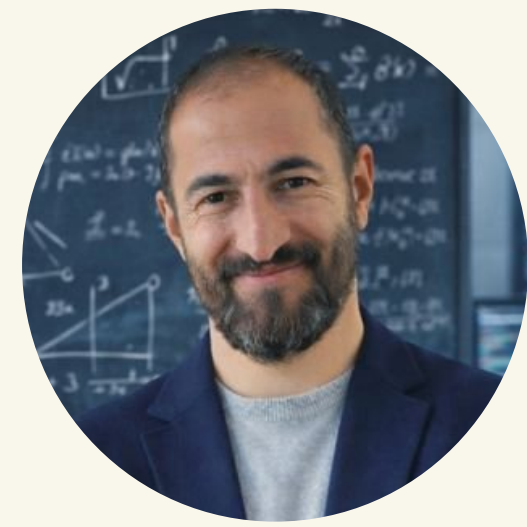
İnan Ünal Munzur Üniversitesi