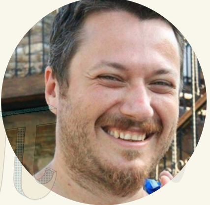
Özgür Martin Mimar Sinan Güzel Sanatlar Üniversitesi