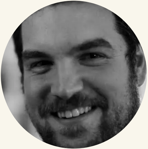
Alp Bassa Boğaziçi Üniversitesi