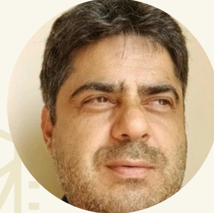
Ünver Çiftçi Namık Kemal Üniversitesi