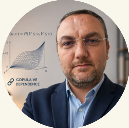
Selim Orhun Susam Munzur Üniversitesi